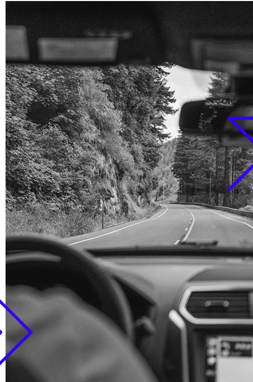
Φιλικότερος προς το περιβάλλον τρόπος ζωής