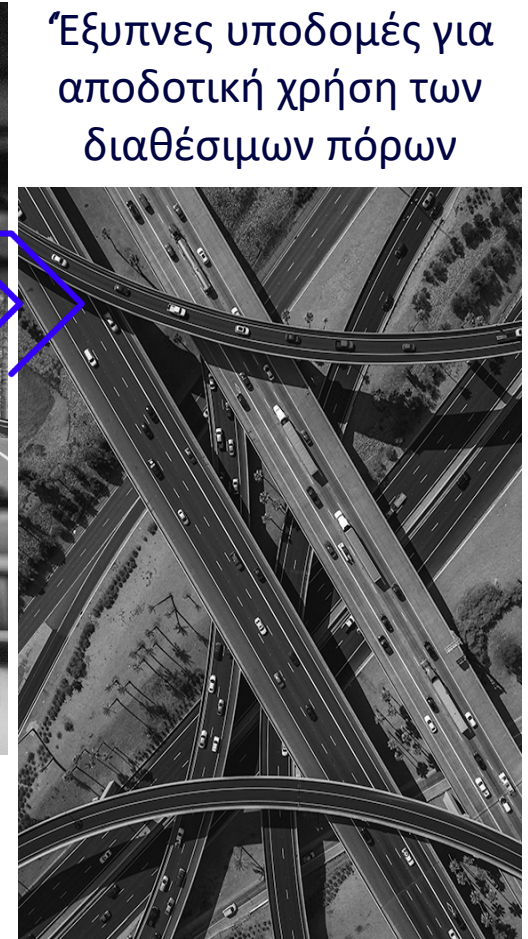
Έξυπνες υποδομές για αποδοτική χρήση των διαθέσιμων πόρων